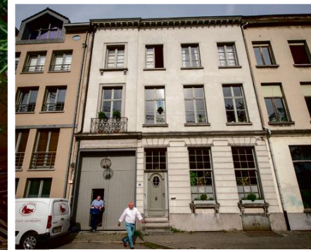
De mooie voorgevel van het pand in de Generaal Belliardstraat.