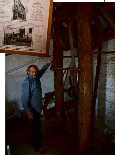
Links: Dirk bij de katrol waarmee destijds de goederen naar boven gehesen.