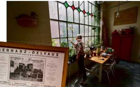
Kader links: Het enorme huis kwam in de vorige eeuw in handen van de familie Gerharz-Delvaux die hier paardenstallen had.

De binnenplaats heeft veel weg van een terrasje in de Provence, met hoge muren vol klimop en een blauwe regen, bloembakken, een ijzeren koepel met wijnranken en gietijzeren tuinmeubeltjes. “Vroeger was de binnenplaats volledig overdekt”,